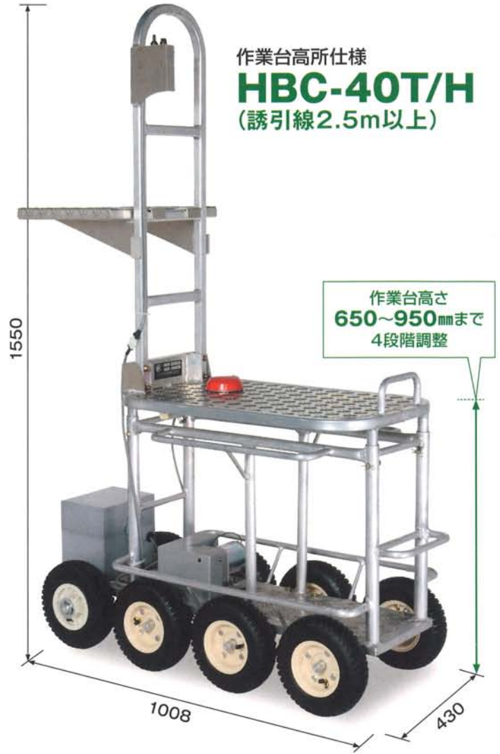
作業台高所仕様 HBC-40T/H (誘引線2.5m以上)