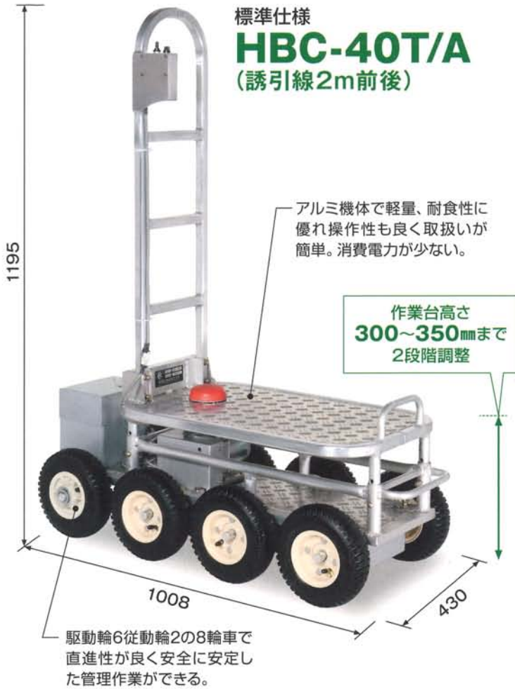
標準仕様 HBC-40T/A (誘引線2m前後)